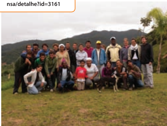
LUCA FANELLI / ISA

SAIBA MAIS ACESSANDO: www.socioambiental.org/nsa/detalhe?id=3161