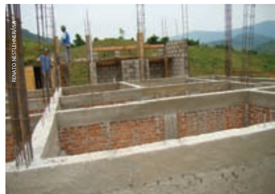
Obras em andamento no quilombo de Porto Velho

Tiveram início em outubro as obras de construção da Casa de Mel da comunidade quilombola de Porto Velho, em Iporanga, no Vale do Ribeira (SP). O projeto é financiado pela Fundação Banco do Brasil e conta com apoio do Instituto de Terras do Estado de São Paulo (Itesp), parceiro em atividades de produção apícola, e do Instituto de Tecnologia de Alimentos (Ital), parceiro na elaboração do projeto executivo da obra. Técnicos do ISA acompanham o processo. A unidade vai beneficiar e envasar a produção apícola de 18 famílias da comunidade, que hoje alcança quatro toneladas por safra. A médio prazo, a casa deverá receber a produção das comunidades quilombolas de Cangume e Praia Grande, vizinhas ao empreendimento, que já estão sendo capacitadas pelo Itesp. A expectativa é de que a casa seja entregue à comunidade no primeiro semestre do próximo ano.