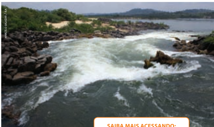
Volta Grande do Rio Xingu, onde será construída a usina de Belo Monte

Também em setembro, o relator especial da ONU sobre direitos humanos e liberdades fundamentais indígenas, James Anaya, leu, em Genebra, relatório