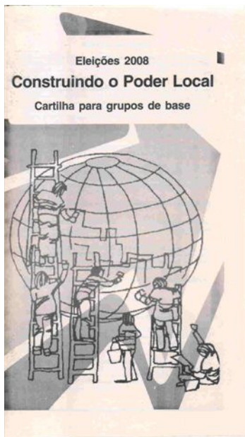
Cartilha para as eleições municipais