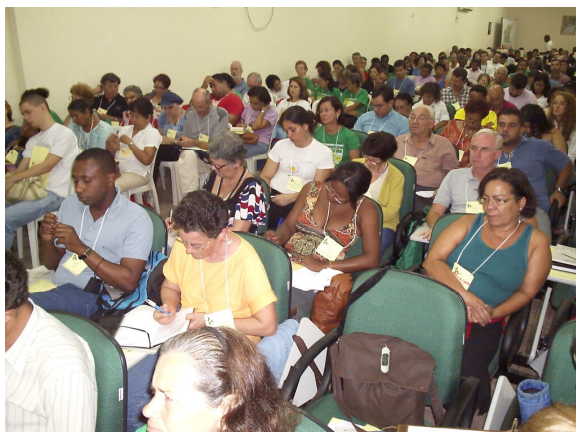
Encontro de Fé e Política em Mesquita - RJ