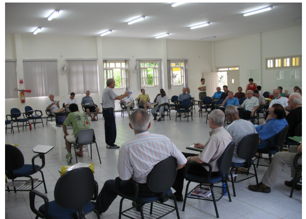
Assessoria a franciscanos: Vila Velha - ES