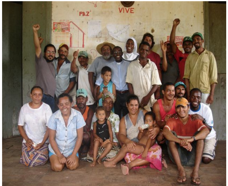
Mozambicanos em visita a comunidade rural do Nordeste