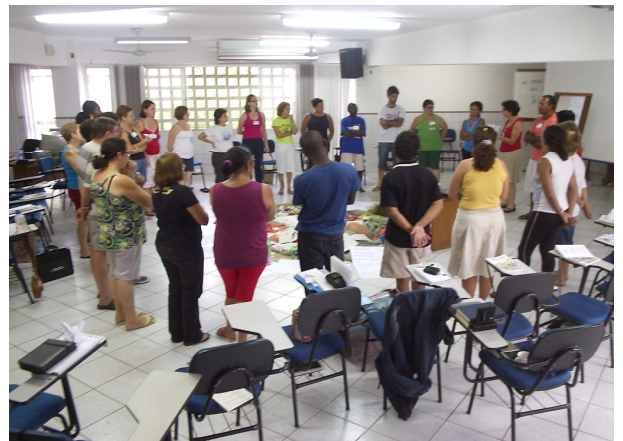
Intercâmbio Moçambique: Curso CEBI em Vitória - ES