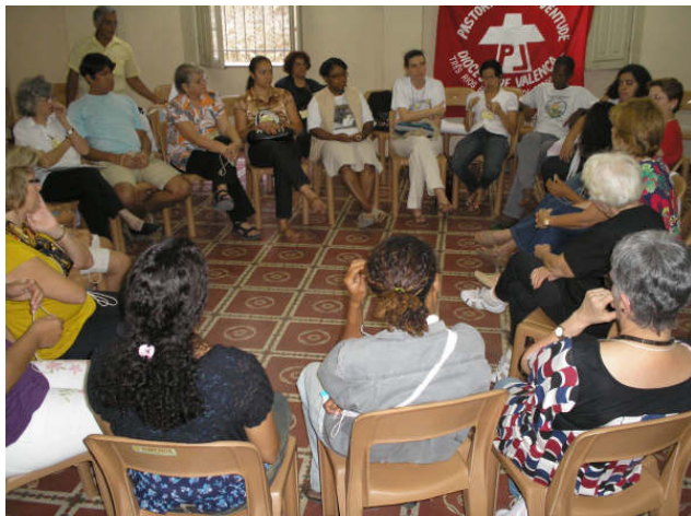
Curso do Rio 2008