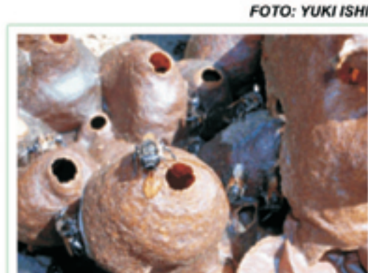
Potes de mel

Os ninhos de abelhas sem ferrão são capturados da natureza somente para formar o plantel inicial. Uma vez formado esse plantel, várias técnicas podem ser utilizadas para a multiplicação dos ninhos, reduzindo, dessa forma, a necessidade de retirada das abelhas de seu local de origem. A espécie de abelha a ser criada deve ser selecionada de acordo com a região de ocorrência.