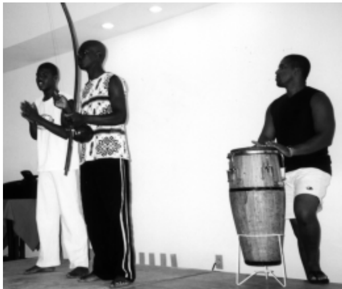
Seminário de Culminância Trimestral - 16/12/2000